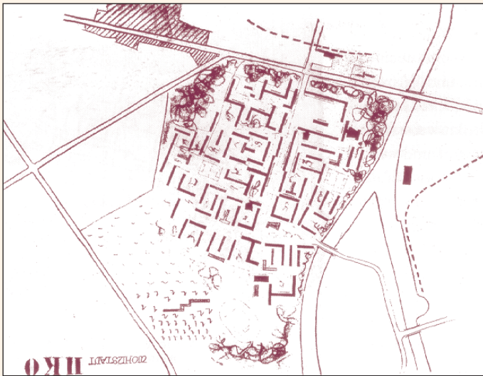
Planskizze, 1950 (Franz Ehrlich)

Bald nach Beginn der ersten Rodungsarbeiten für das neue Eisenhüttenkombinat im August 1950 wurde Franz Ehrlich (geb. 1907) mit ersten Planungen für eine „Wohnstadt“ beauftragt. Der Architekt, Stadtplaner und Gestalter war Bauhausschüler und ein Vertreter der Moderne. Er entwarf eine aufgelockerte Stadtlandschaft in funktionalistischer Zeilenbauweise, die er aus dem vom ihm erarbeiteten „Achssystem“, einer Zusammenstellung modularer Einheiten, entwickelte. Ehrlichs Strukturpläne wurden jedoch wegen seines der Moderne verpflichteten Planungskonzeptes und wegen dessen Abweichungen von der offiziellen Städtebaudoktrin der „16 Grundsätze des Städtebaus“ (1950) sowie der darin festgeschriebenen Orientierung an der „nationalen Form“ verworfen. Er war später als Direktor der VVB Industrieentwurf (ab 1951) an Planungen von Industriebauten für das EKO - Werk beteiligt.