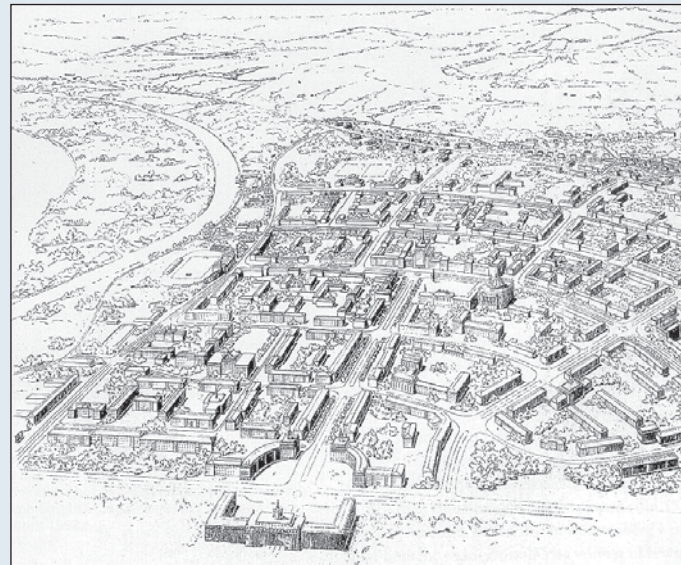
Perspektive der Wohnstadt beim Eisenhüttenkombinat Ost (Fürstenberg) 1952 (K. W. Leucht)

Das städtebauliche Erbe Stalinstdts, der „ersten sozialistischen Stadt“ in Deutschland - 1961 umbenannt in Eisenhüttenstadt -, dokumentiert das Ergebnis eines spannungsreichen historischen Planungsprozesses. „Zwischen Moderne und Nationaler Tradition“ entwarfen und realisierten die Architekten und Planer in Auseinandersetzung mit den Vorgaben von Partei und Staat Stadtstrukturen und Gebäude mit noch heute hoher Qualität und Zukunftsfähigkeit. Ihre mehrfache historische Neubewertung zwischen Glorifizierung und Kritik, die sich unter anderem in den Debatten um den Denkmalschutz (Lindenallee 1975; WK I – III 1984) zeigte, spiegelt den ständigen Wandel der architekturgeschichtlich-stadtpolitischen Meinungen im Verlauf der 50jährigen Geschichte der Stadt. Dieses Faltblatt benennt stellvertretend einige der heute kaum mehr bekannten Stadtplaner und Architekten, die die Stadt, ihre Gebäude und Grünflächen entworfen und gebaut haben.